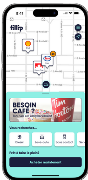
Carte des stations